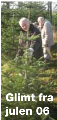
Glimt fra julen 06